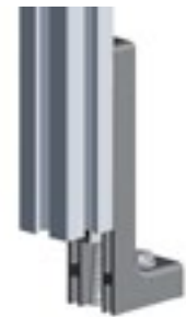
Bodenwinkel 120, höhenverstellbar Adjustable Floor Bracket 120